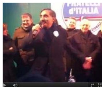
Ignazio La Russa parla IN TEDESCO di Mario Monti...