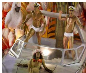
Brasile, esplode il Carnevale di Rio. Foto...